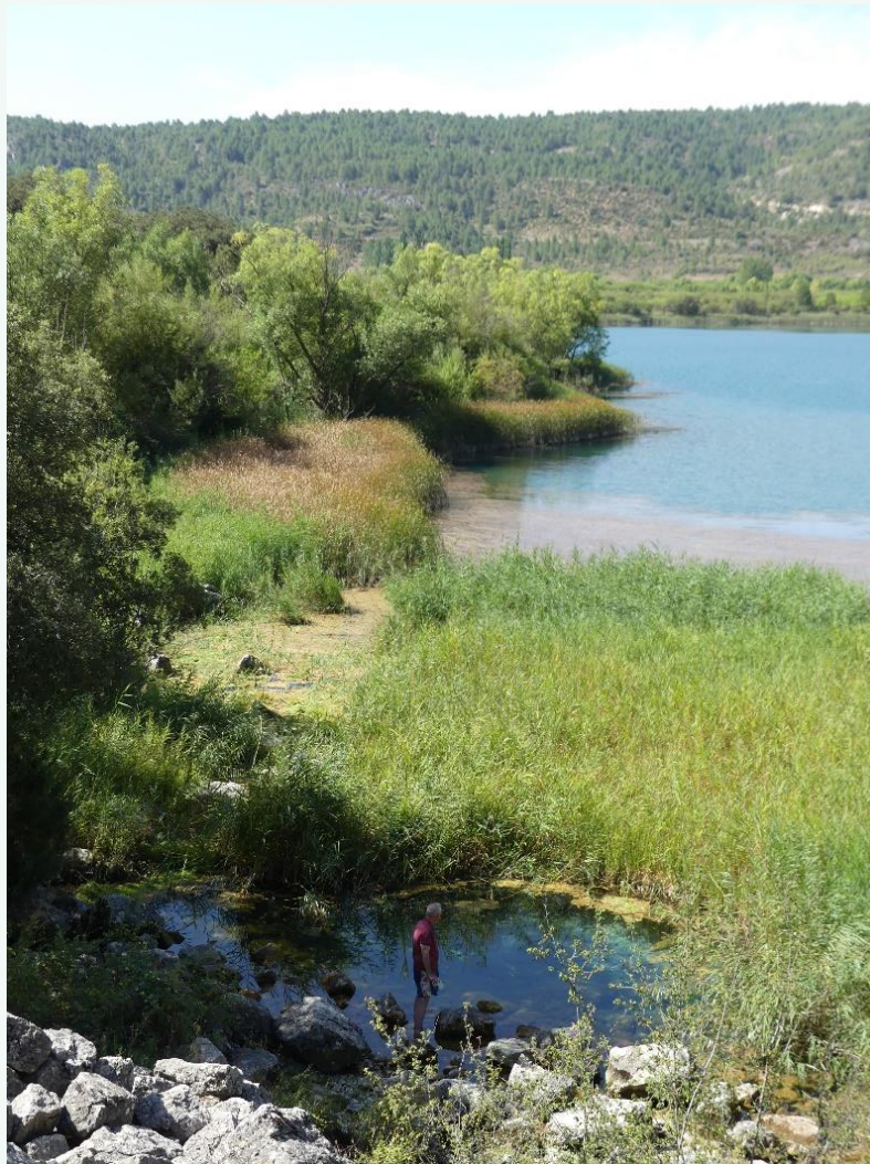
Surgencia nororiental en agosto de 2017. Sí, el de la foto soy yo.

-Se aprecia una corriente superficial fuerte en dirección SW-NE, proveniente del canal de entrada desde el embalse del Molino de Chincha.