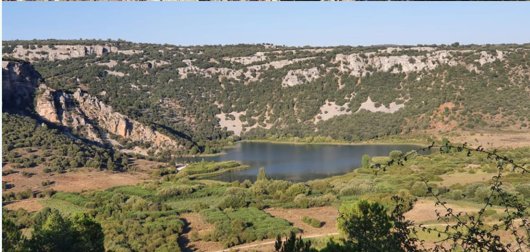
La laguna de El Tobar, vista desde el norte (fotografía superior) y desde el sur (fotografía inferior). La cubeta meromíctica solo se insinúa a la izquierda de la instantánea inferior.