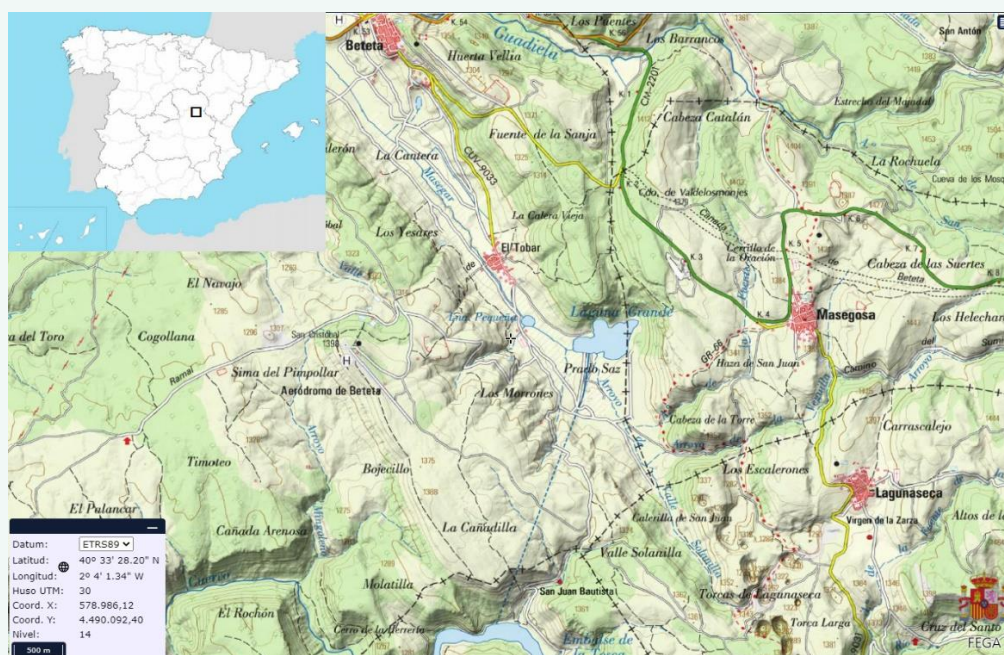
Ubicación de la laguna del Tobar (Beteta, Cuenca).

A continuación, os referiré algunas observaciones sin aparatos realizadas en la laguna de El Tobar (Serranía de Cuenca) durante los meses de agosto de dos veranos consecutivos; el orden no es temático, sino más o menos cronológico. Buena parte de ellas se ha hecho desde una playita de la orilla oriental y nadando en un transecto largo paralelo a esta. Esta laguna es meromítica y su limnología se conoce relativamente bien. Hace décadas, fue convertida en una reserva de agua para usos hidroeléctricos, cuyo nivel se mantiene artificialmente con agua procedente del cercano embalse del Molino de Chíncha. Una divulgación de su ecología, que incluye toda la bibliografía existente, se ofrece en Álvarez Cobelas & Rojo (2020).